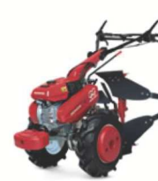
07 VERSATILI 1 VERSIONI