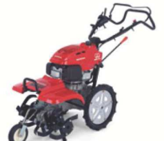
09 MOTOZAPPE CONTROROTANTI 3 VERSIONI