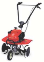
07 COMPATTE 5 VERSIONI