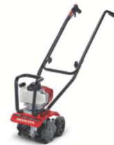
05 MICRO 2 VERSIONI