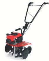
05 MINI 2 VERSIONI